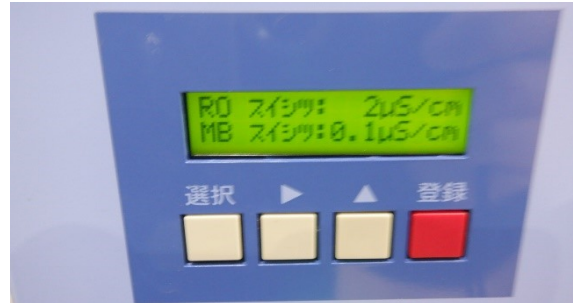
水質表示:RO水質2 \mu S/cm カートリッジ純水器出口0.1 \mu S/cm