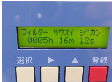
フィルター通水時間約5Hr