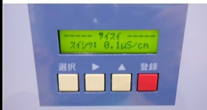
採水 水質0.1 \mu s/cm