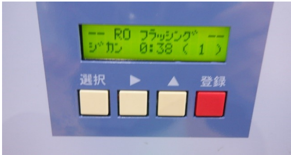
ROフラッシング時間設定1分(経過38sec)