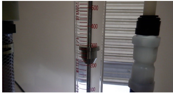
フラッシング時の流量 300L