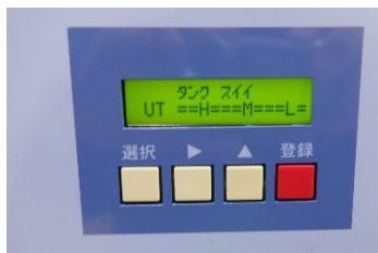
純水タンク量:満水に近い