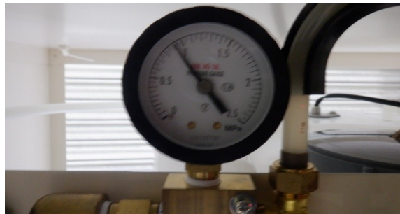
採水中 濃縮水圧力