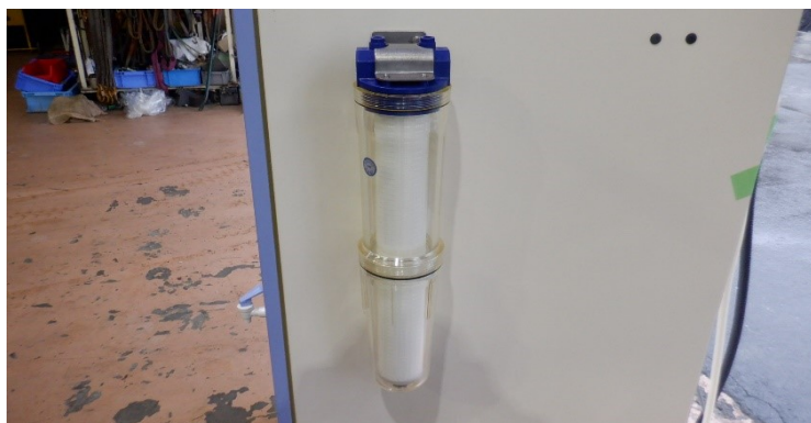
フィルターが付属しています。使用されていない？