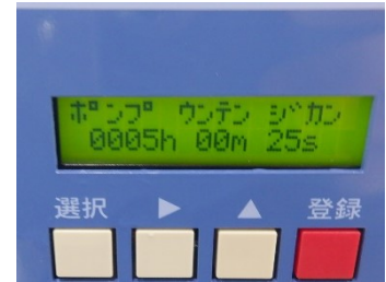
ポンプ運転時間 約5Hr